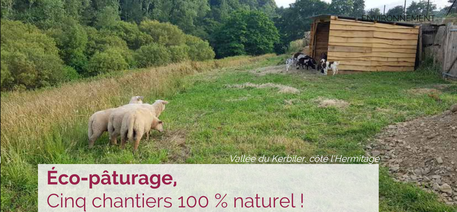
Vallée du Kerbiler, côté l'Hermitage