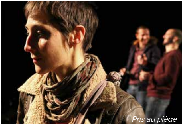
Pris au piège

Une création, « Relations Parents/ados : si on en parlait ? », a démarré en juillet dernier en partenariat avec le Conseil Municipal Jeunes de la Ville de Vannes, le Relais Prévention santé, la Caisse d'Allocation Familiale du Morbihan et la Maison des Ados de Vannes et donnera lieu à une représentation mardi 15 octobre à 18h à l'Auditorium des Carmes à Vannes.