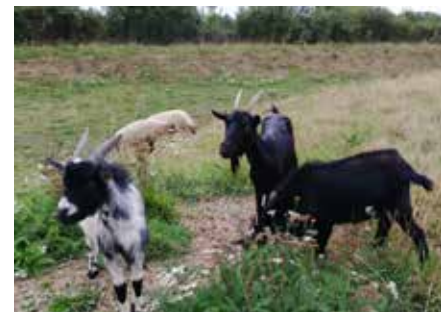
Bassin de rétention - Déchèterie