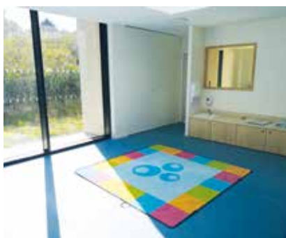
Salle « Patouille »

Un grand espace extérieur accueillera des espaces de jeux. Les préconisations des services de la PMI pour sa partie ALSH 3-6 ans ont été respectées. Une attention toute particulière a été portée à la qualité acoustique du bâtiment ainsi qu'à son fonctionnement, répondant aux nouvelles normes environnementales en matière d'économies d'énergie. Ce projet présente également l'avantage de la proximité directe de la cantine.