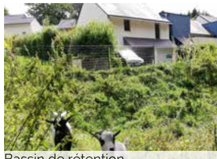
Bassin de rétention Rue des Terrasses