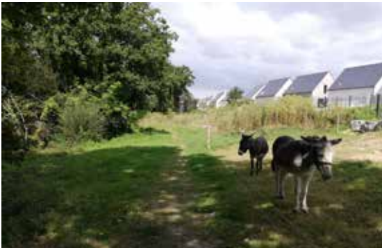
Vallée du Kerbiler - Côté la Motte Verte

Moutons, chèvres et ânes entretiennent toute l'année cinq lieux d'éco-pâturage. Aujourd'hui nous avons choisi de vous présenter le mouton des Landes de Bretagne. C'est un mouton local et rustique de la Bretagne historique, Le « Landes de Bretagne » peuplait les côtes depuis l'Aquitaine jusqu'à la Hollande ainsi que les côtes anglaises. Il a échappé aux croisements avec les moutons flandrins ou anglais. Cette population se disperse sur toute la Bretagne et disparaît presque jusqu'aux années 1980 où des enseignants de l'Ecole Nationale Vétérinaire de Nantes, sous la direction du Professeur Bernard Denis, repèrent et s'intéressent à un petit troupeau vivant à l'état de relique en Brière. En 2011, 2 345 brebis étaient réparties sur la région Bretagne, la Loire-Atlantique et les départements limitrophes. En participant à l'achat de ces femelles, nous contribuerons à la sauvegarde de la race ; voici les 4 futurs pensionnaires de la race des Landes de Bretagne qui prendront place (dans les prochains mois) dans la vallée du Kerbiler.