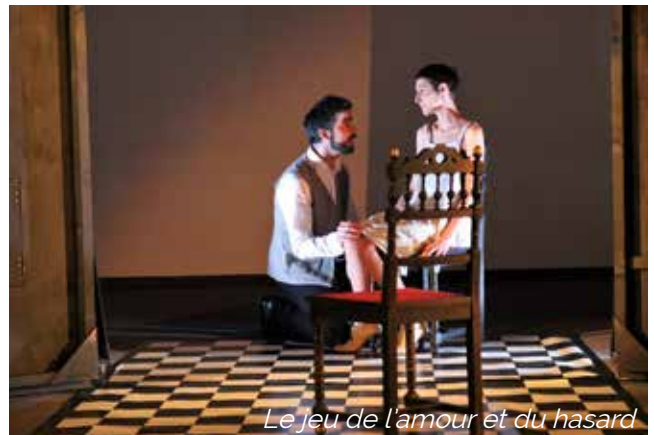
Le jeu de l'amour et du hasard

Les artistes n'oublient pas le public Elvinois puisque deux créations seront cette saison présentées dans le cadre du Printemps du théâtre en partenariat avec le Centre Socio-Culturel et la Mairie d'Elven.