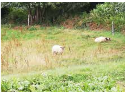
Giratoire de la Grande Lande