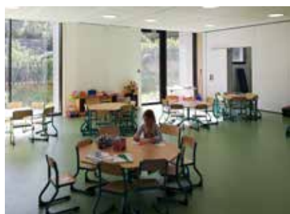
Salle d'activités modulables

Le bâtiment de plain-pied, de 680 m 2 offre un espace de travail et d'activités fonctionnel pour les enfants mais également pour les animateurs. Un hall permet l'accès aux différentes salles et aux vestiaires. Les lieux de vie laissent place à la créativité et sont également modulables grâce aux cloisons mobiles qui y sont installées. Le bâtiment est également doté de deux salles de sieste, une pour les « petits dormeurs » et une autre pour les « grands dormeurs ». Une salle « patouille », des bureaux et des locaux techniques complètent ces installations.