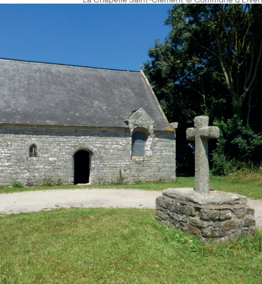
La Chapelle Saint-Clément