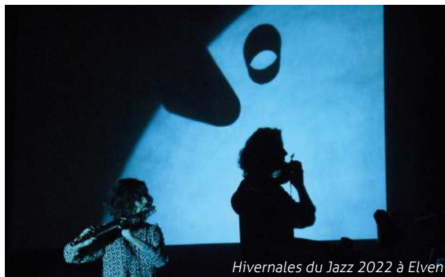
Hivernales du Jazz 2022 à Elven

Quant à la Fête de la Musique, elle devrait faire swinguer Elven le 17 juin .