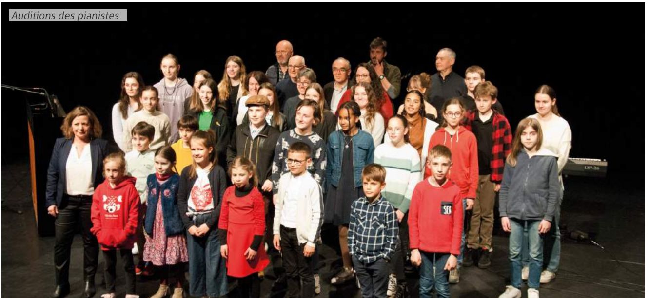
Auditions des pianistes

Centre Socio Culturel d'Elven 02 97 53 30 92 - www.csc-elven.fr