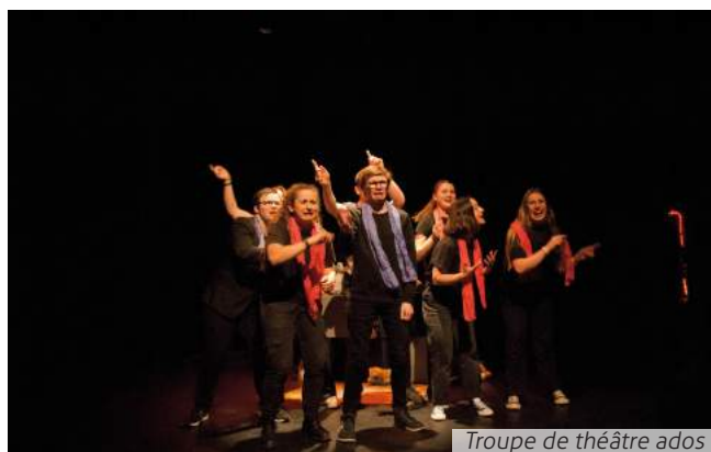
Troupe de théâtre ados

La troupe de théâtre amateur du centre socio-culturel, très attendue par le public, a attiré plus de 600 spectateurs durant le week-end. Les comédiens incarnant avec beaucoup de talent des personnages aussi étonnants que drôles ont été chaleureusement applaudis. D'autres pièces sont venues étoffer la saison telle que « La légende de verbunshneck » dont