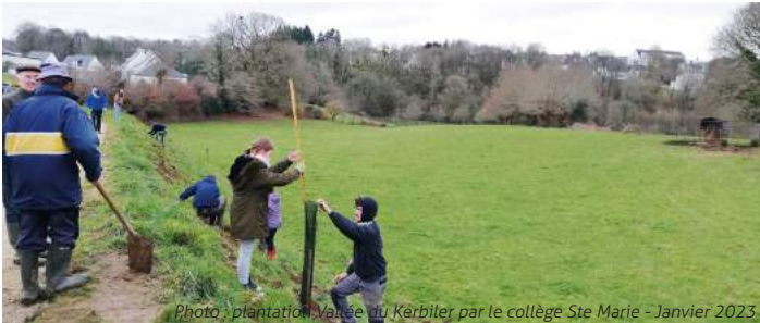
Photo : plantation Vallée du Kerbiler par le collège Ste Marie - Janvier 2023

APPRENDRE À PROTÉGER NOS RICHESSES NATURELLES