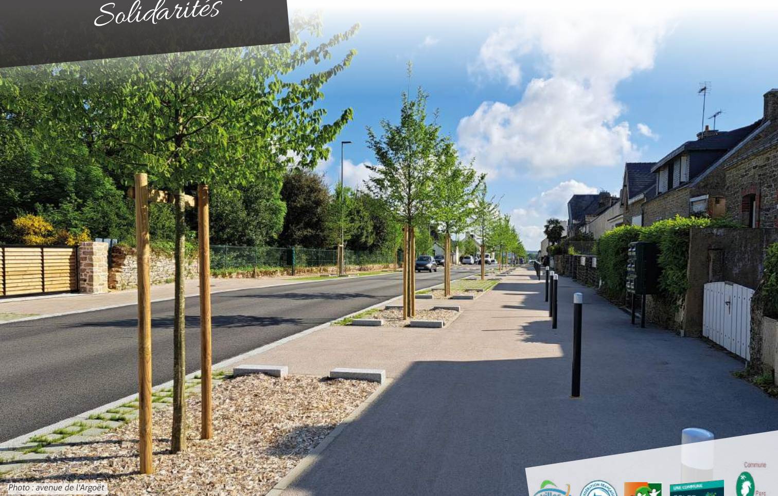
Photo : avenue de l'Argoët