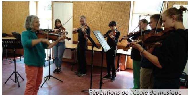
Répétitions de l'école de musique

Et la saison théâtrale continue... Le temps des répétitions est arrivé pour l'école de musique. Depuis le mois de mars, des groupes se constituent afin de présenter des morceaux pour le concert du mois de juin. Cette année, le centre socio-culturel et l'association de la chapelle St Clément s'associent pour organiser un concert des élèves de chant. L'occasion pour le public de venir découvrir cette jolie chapelle et de profiter de son acoustique. Quant aux pianistes, ils étaient en audition le 7 avril pour partager leurs morceaux avec amis et famille.