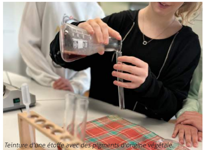
Teinture d'une étoffe avec des pigments d'origine végétale.