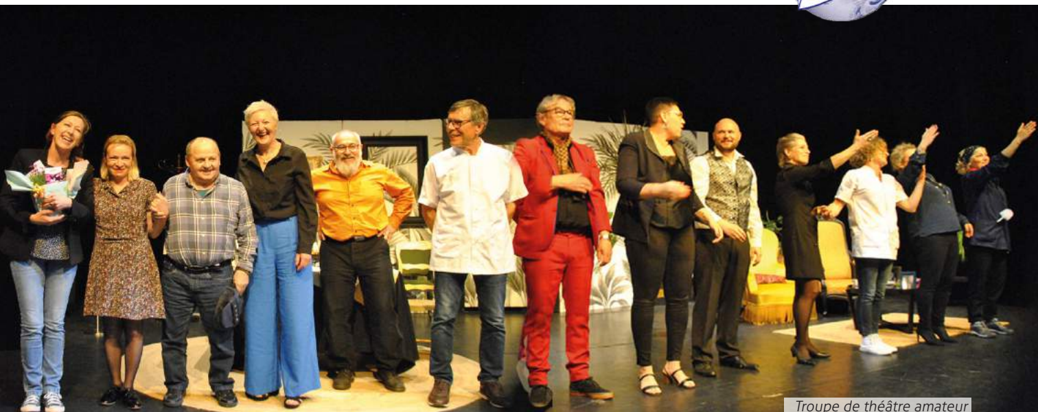
Troupe de théâtre amateur