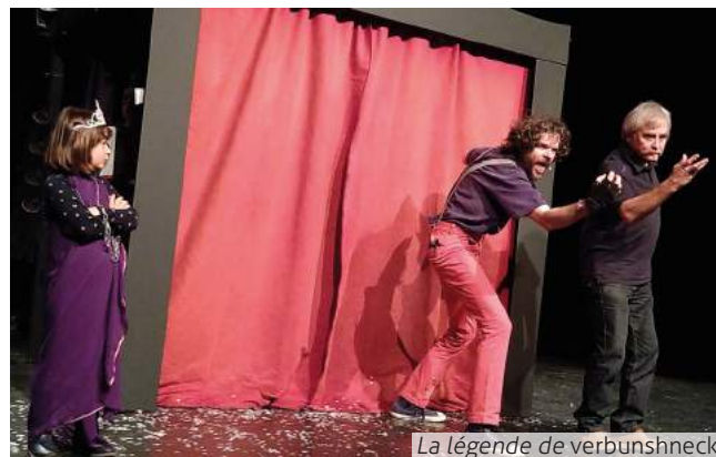
La légende de verbunshneck